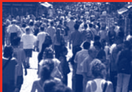
La Rambla.