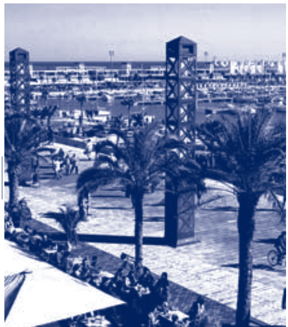
Port Olímpic.